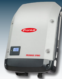
Wechselrichter mit integrierten Energiemanagementfunktionen sorgen für eine maximale Stromausnutzung unter Einhaltung aller Netzanforderungen.