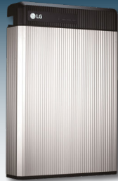
Batteriespeicher ermöglichen den Verbrauch von Solarstrom auch am Abend und in der Nacht.