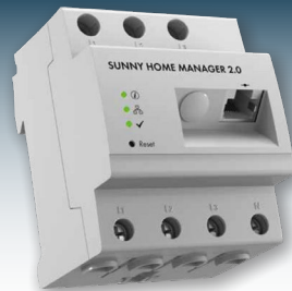
Intelligente Geräte gewährleisten ein vollautomatisches Lastmanagement.