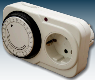
Zeitschaltuhren als einfachste Form des Lastmanagements.

Insbesondere Verbraucher, die nicht an bestimmte Betriebszeiten gebunden sind, lassen sich so äußerst rentabel direkt mit Solarstrom betreiben. Moderne Technik bringt Verbrauch und Erzeugung in Einklang.