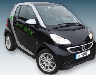
Elektroautos können Solarstrom wirtschaftlich speichern und machen so umweltfreundlich mobil.