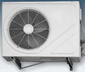
Klimaanlagen und Wärmepumpen eignen sich hervorragend für den Betrieb mit Solarstrom.

Auch durch die Speicherung von Strom kann die Eigenverbrauchsquote weiter erhöht werden. Die sinnvolle Nutzung von Speichern lässt sich aber insbesondere durch sich daraus ergebende Zusatznutzen definieren.